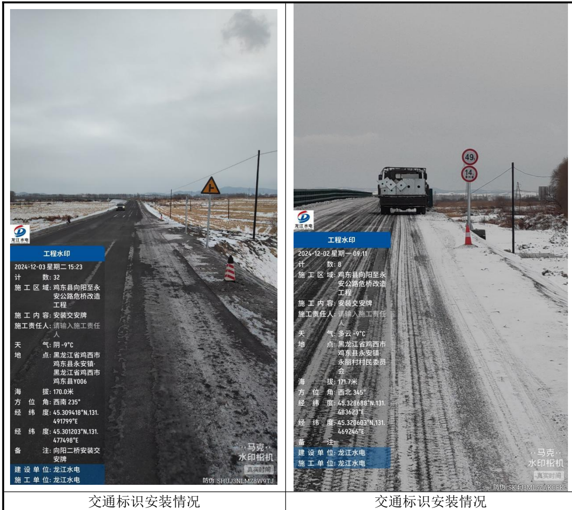
交通标识安装情况